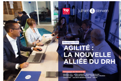
Agilité : la nouvelle alliée du DRH - 2019