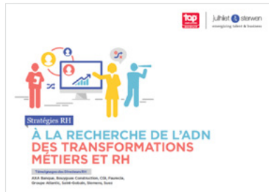
À la recherche de l'ADN des transformations des métiers et RH - 2018